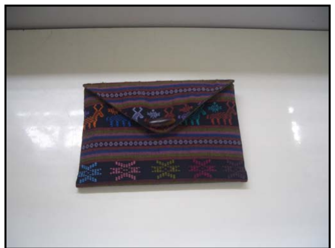
กระเป๋าใส่สมุดโน้ต