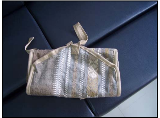
กระเป๋าใส่เครื่องสำอางไว้ในกระเป๋าเดินทาง